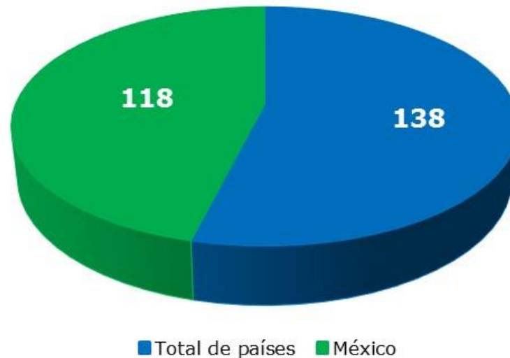
Posición de México en Materia de Carga Regulatoria de acuerdo con el World Economic Forum 2016