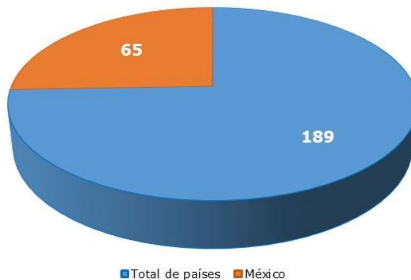
Posición de México en materia de Apertura de Negocios de acuerdo con el Doing Business 2016